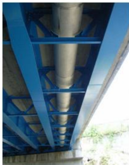
大阪府 豊中市 SUS304 500A 27m