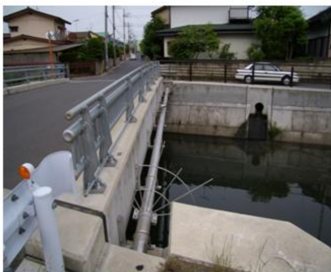
茨城県 水戸市 SUS304 150A 添架長さ 18m