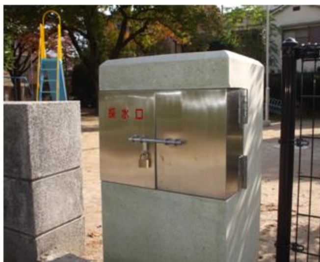
大阪府 岡町北公園 採水口扉