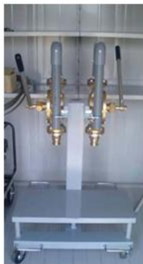
大阪府茨木市 東雲運動広場緊急貯水槽 貯水槽用エンジンポンプ ウイングポンプ 40A