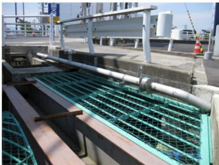
富山市 新庄町 SUS316 100A sch20 12m