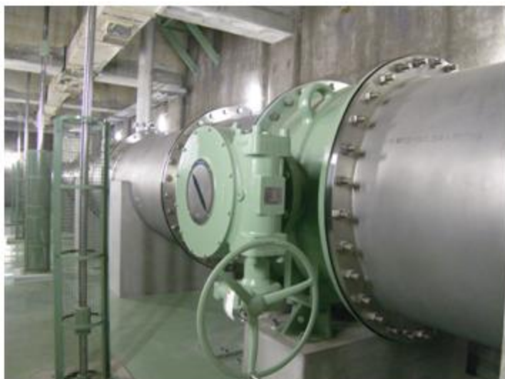
三重県 川越町 SUS304 1500A~500A