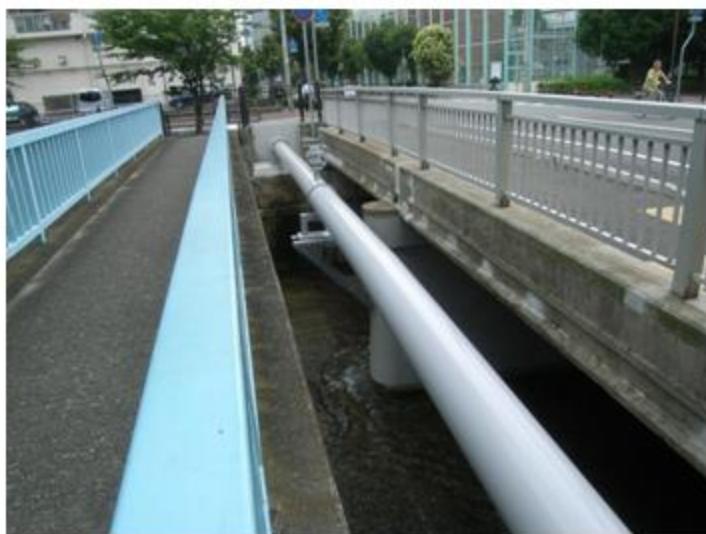
兵庫県 神戸市 L-2A塗装 STPY400 400A 26m