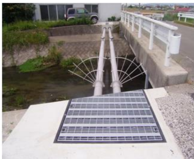
愛媛県 松前町水道課 SUS304 200A 支間長 14.5m