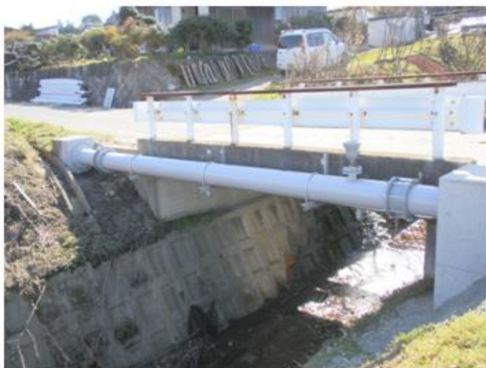
滋賀県 高島市 L-2塗装 SGP 300A 6.8m