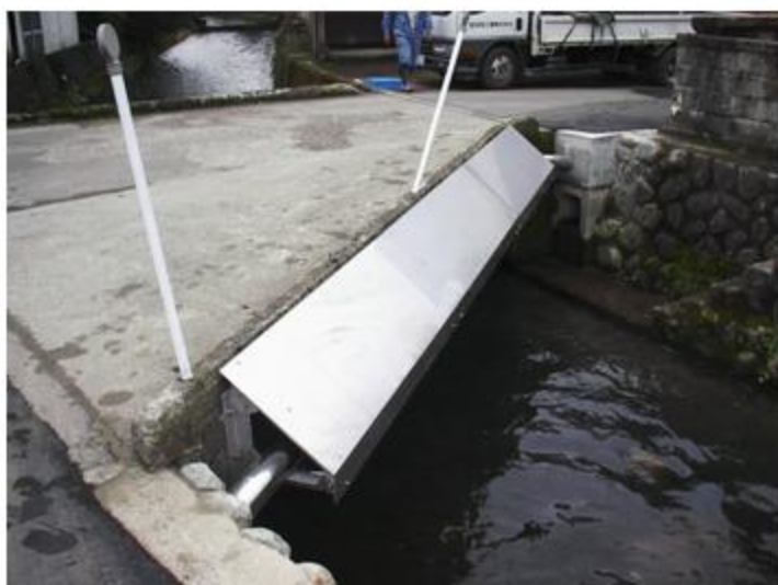
福井県 大野市 SUS304 80A+ラッキング 添架長さ 11m