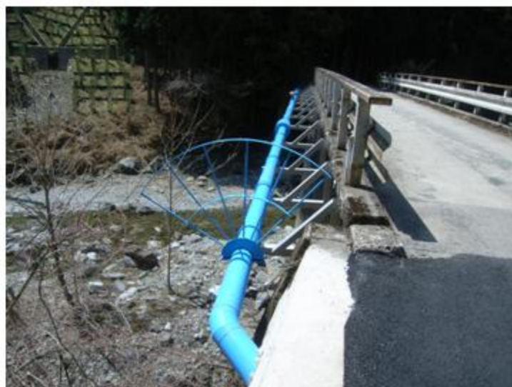
三重県 津市 SUS304 NCP 150A / 80A 29.2m