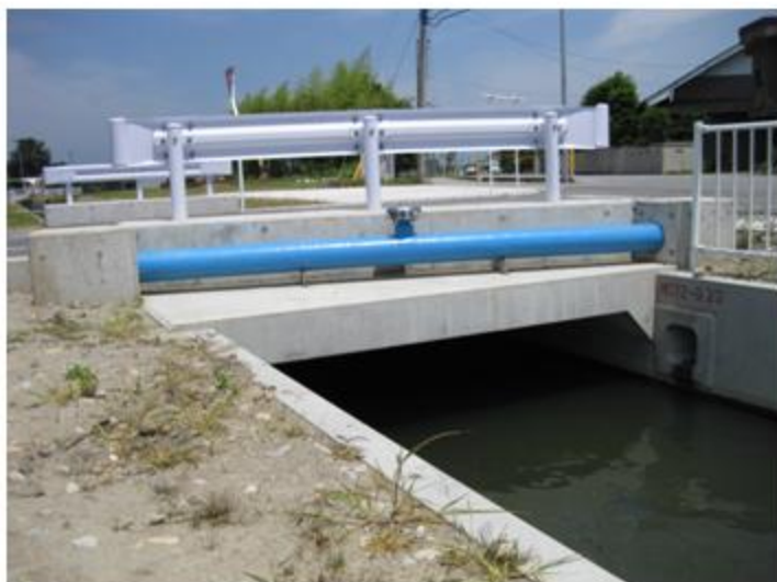
富山県 上市町 SUS304 水管橋 (FRP防食) 8m