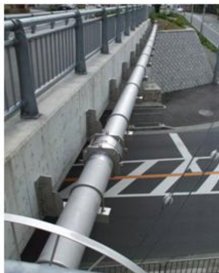
大阪府 箕面市 SUS304 300A 添架長さ 37m