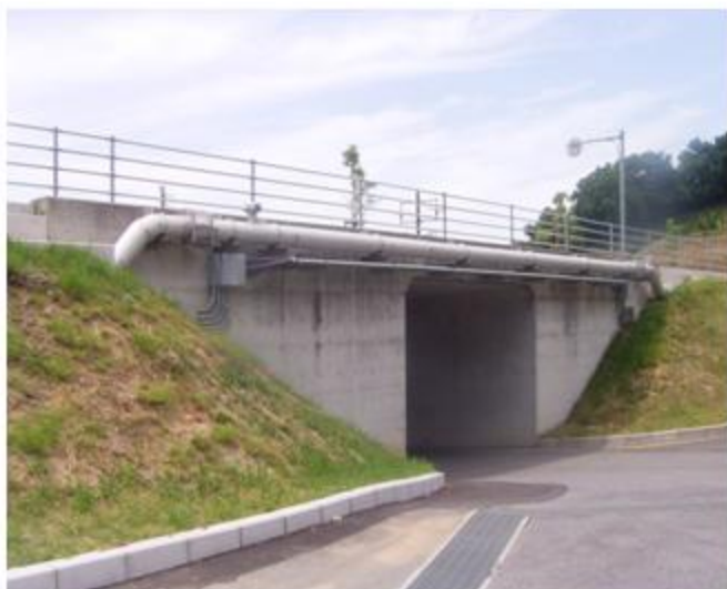
愛媛県 松山市 SUS304 350A 支間長 20.54m