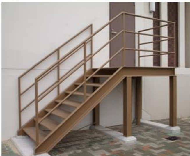
大阪府 大阪市 SS400 階段