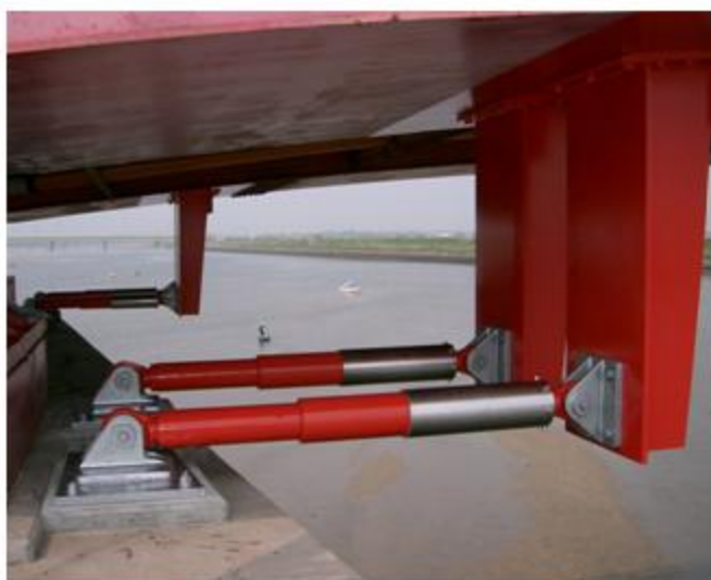
愛知県 矢作川大橋