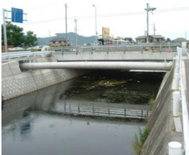
徳島県 小松島市 SUS304 600A 添架長さ 18.3m