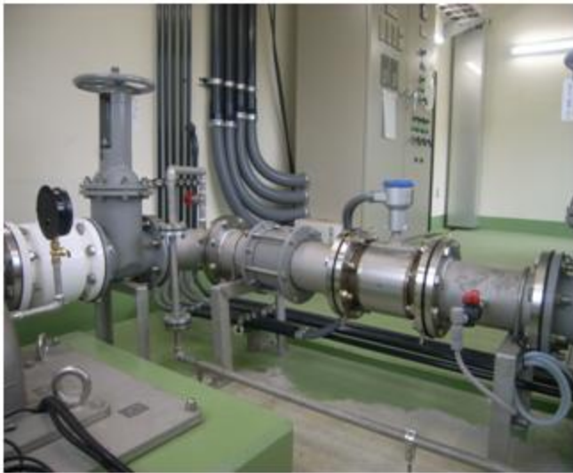
岐阜県 岐阜市 SUS304 200A・150A