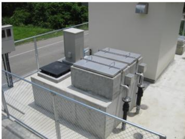
富山市 八尾町 SUS304 被せ蓋