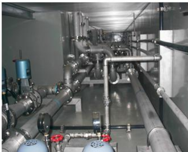
兵庫県 佐用町 SUS304 200A~50A