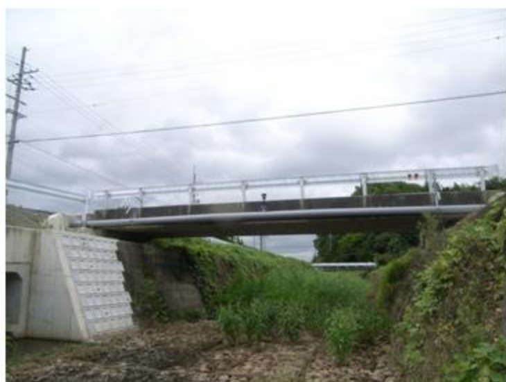
滋賀県 彦根市 L-2塗装 STPG 200A 21m