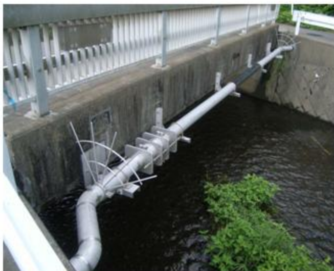
神奈川県 相模原市 水管橋 SUS316 150A 12.4m