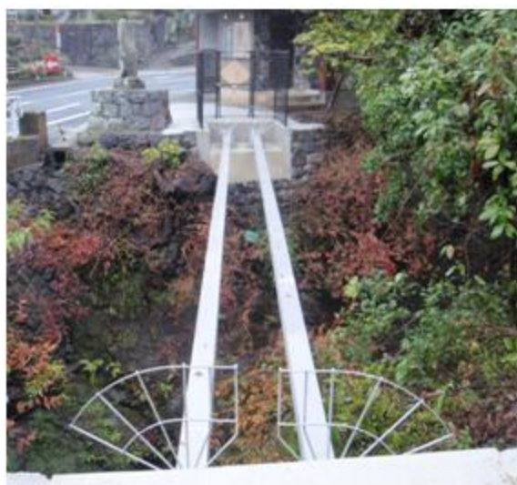
熊本県 熊本市 SUS316 150A 水管橋(π型補強) 添架長さ 22m 23.7m(二条配管)