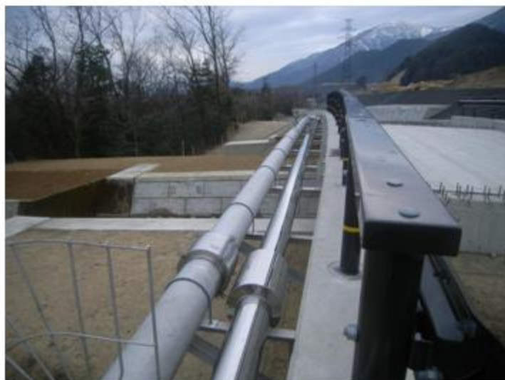
滋賀県 大津市 SUS304 150A 31.4m