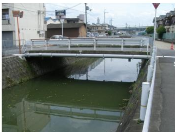
大阪府 藤井寺市 SUS304 200A 14m