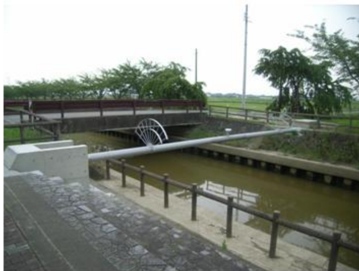
愛知県 稲沢市 SUS304 200A 16.7m