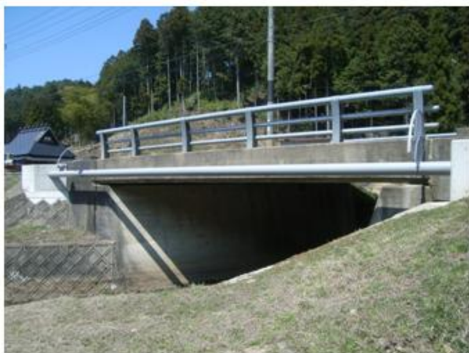
京都府 京北弓削町 SUS304 200A / 100A 20.4m