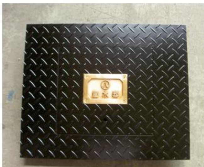
愛知県 名古屋市 メーター筐蓋