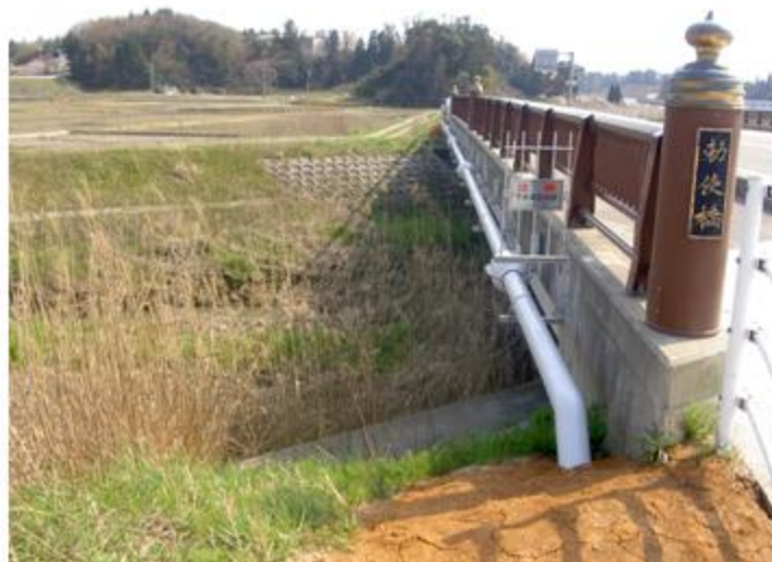
石川県 かほく市 SUS304 80A FRP被覆 添架長さ 41.2m