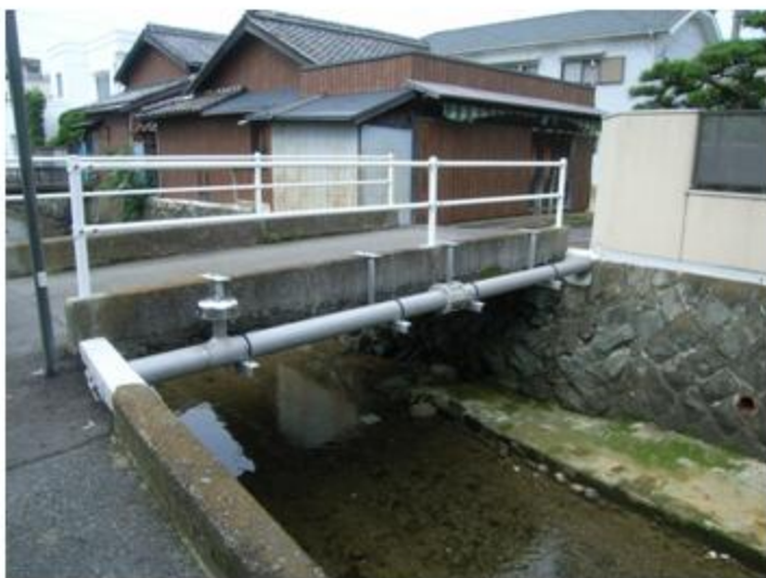
和歌山県 海南市 SUS304 150A 8.2m