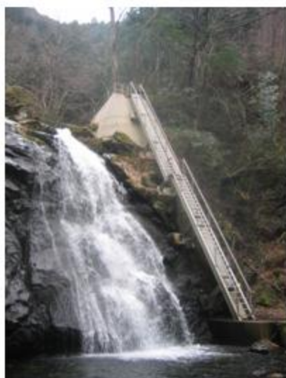
奈良県 川上村 SUS304 取水場管理用階段