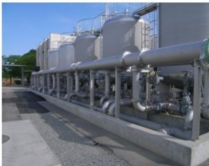
兵庫県 市場水源地 SUS304 300A・100A