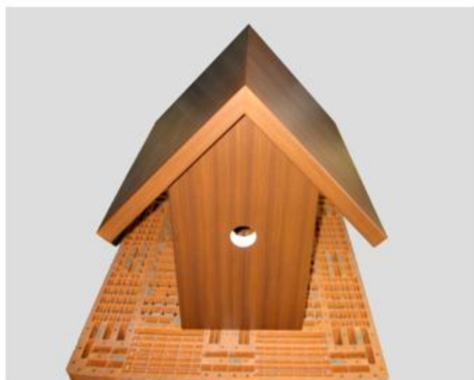
東京都 空気弁BOX 木目調加工