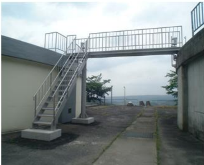
岐阜県 瑞浪市 外部階段・内部階段 ・棧橋・手摺・ガラリー ステンレス製