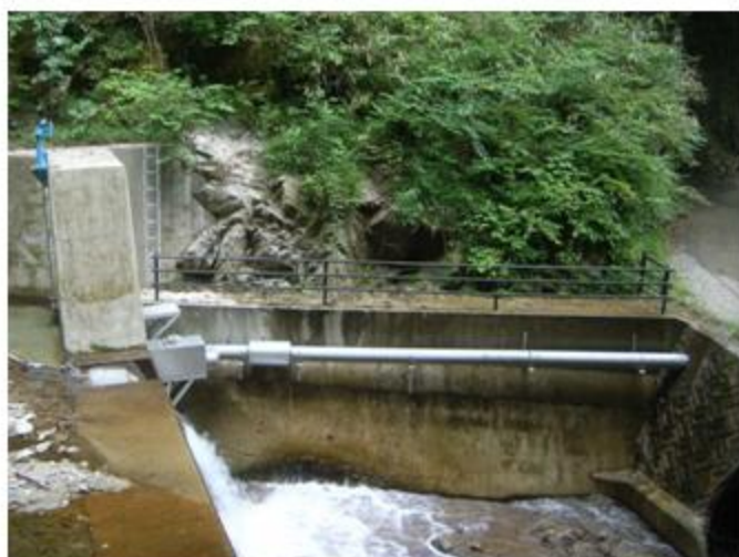
岐阜県 恵那市 SUS304 250A / 150A