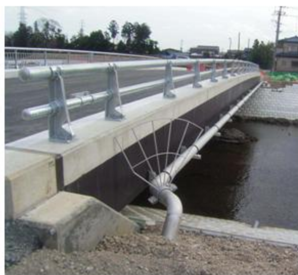
埼玉県 坂戸市 SUS304 150A 添架長さ 31.5m