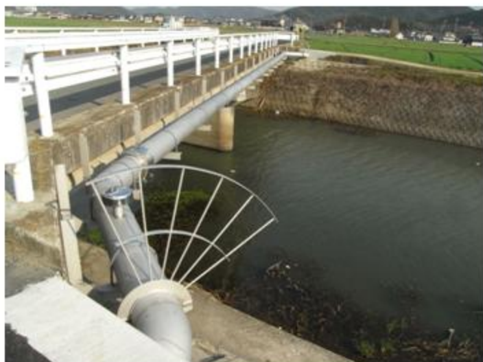
岡山県 瀬戸内市 SUS304 300A 34.3m