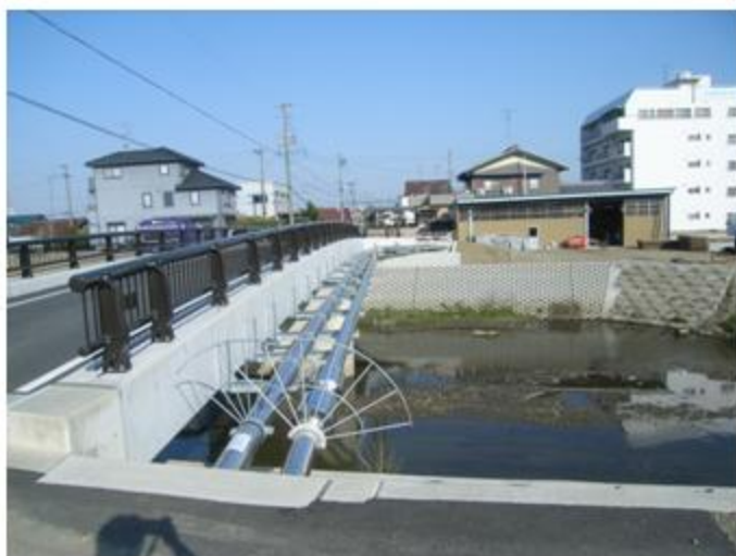
岐阜県 岐阜市 SUS304 150A 58.7m