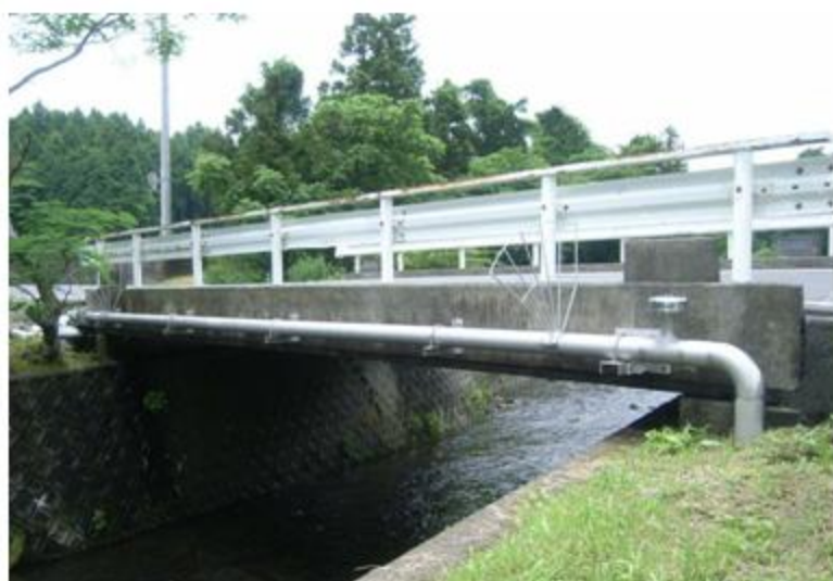
静岡県 御殿場市 水管橋 SUS304 150A 11.7m