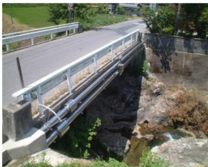
奈良県 榛原町 SUS304 100A 添架長さ 19m