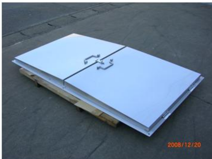
愛媛県 東温市 SUS304 蓋