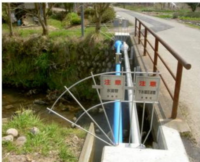
石川県 津幡町 SUS304 50A FRP被覆 添架長さ 9.4m