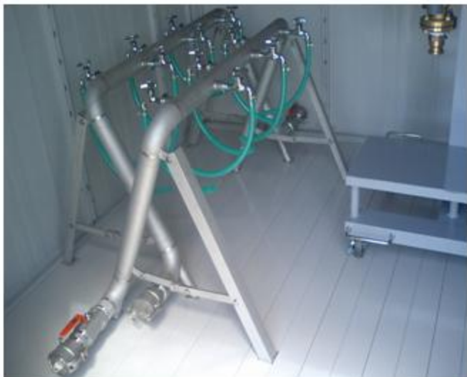
大阪府茨木市 東雲運動広場緊急貯水槽 A型給水スタンド 50A