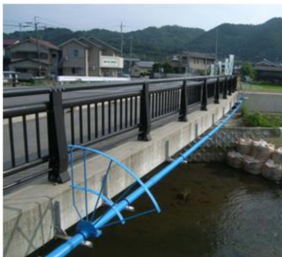
京都府 南丹市 NCP SUS304 80A 23.1m