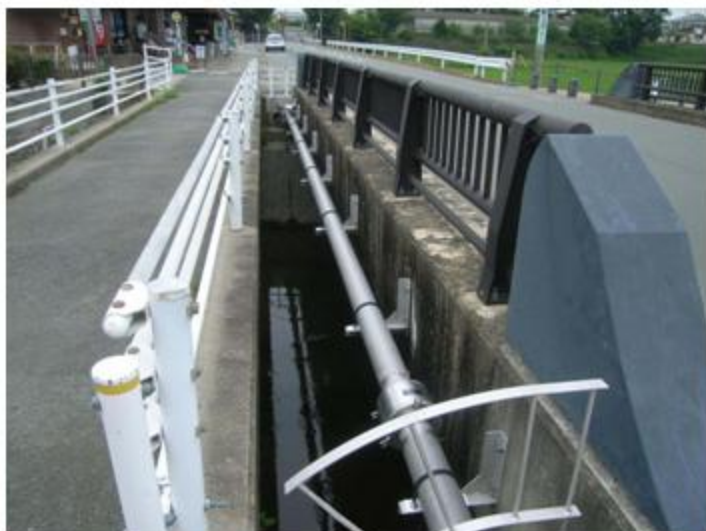
三重県 SUS304 150A 添架長さ 22m