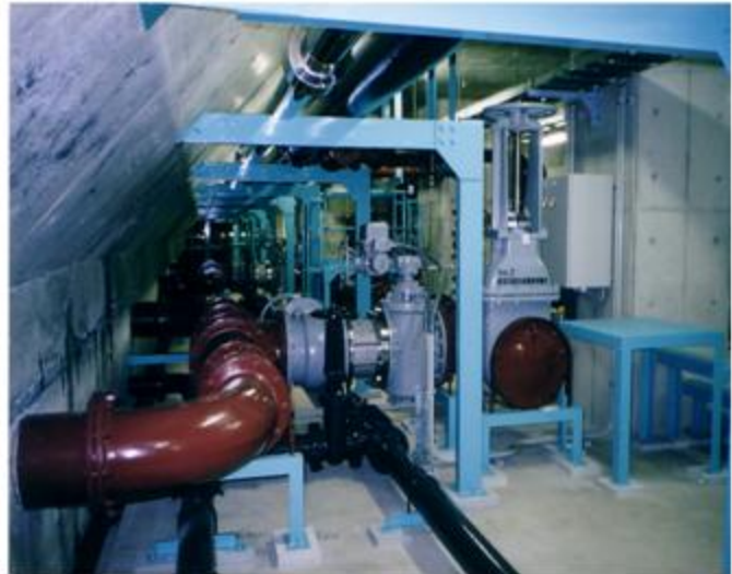
岐阜県 岐阜市 下水処理場内配管 SUS304 400A~100A