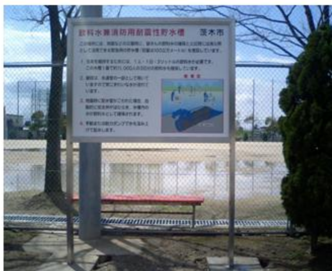
大阪府茨木市 東雲運動広場緊急貯水槽 貯水槽設置案内看板