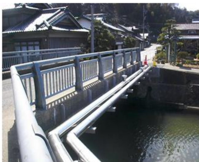
福井県 あわら市 HPPE 100A / SUS SDP 200A 下水 SUS 150A 上水 添架長さ 20.6m