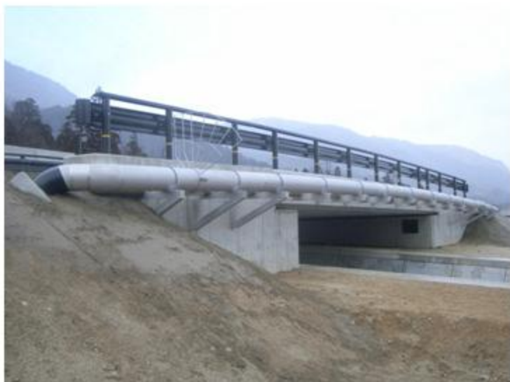
滋賀県 大津市 SUS304 300A 31.4m