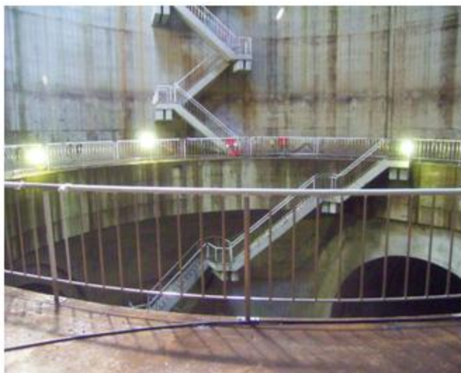
東京都 中野区 SUS304 手摺