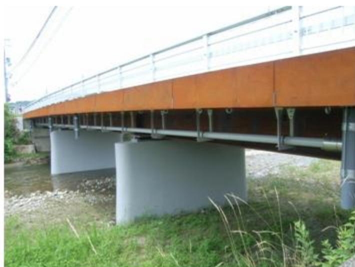
兵庫県 神戸市 SUS304 150A 42.8m