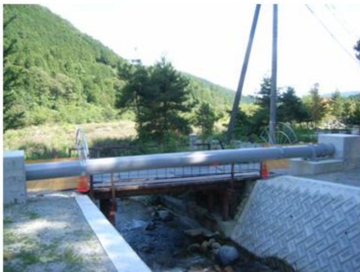
岐阜県 中津川市 ポリウレタン被覆 STPY400 400A 22m