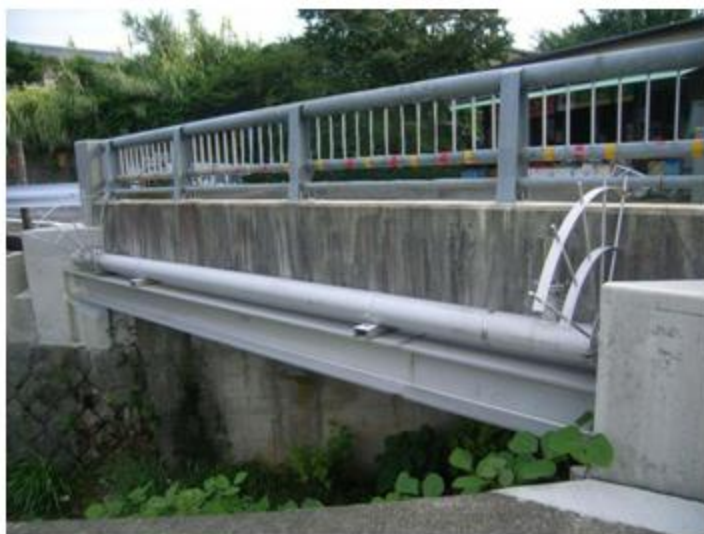
京都府 大枝西町 SUS304 200A 13.6m