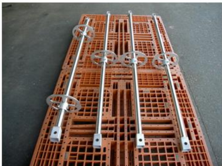
広島県 中間ロッド(振止付)