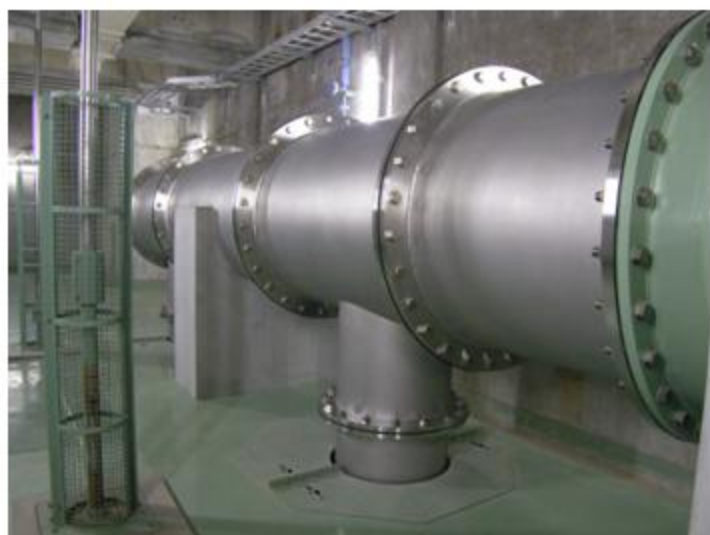
三重県 川越町 SUS304 1500A~500A