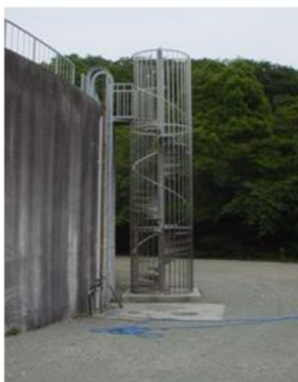
兵庫県 芦屋市 螺旋階段 Φ1700×7m