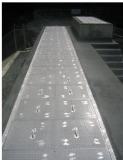
奈良県 川上村 SUS304 縞鋼板蓋